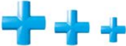
MX8 สี่ทางตรง / Cross