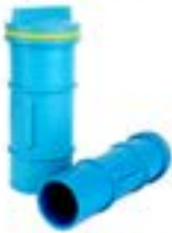
MTECO แก้วดัก / PVC DRAIN PLUG