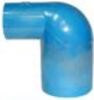
MLR ขั้วลด 90 / REDUCING ELBOW 90