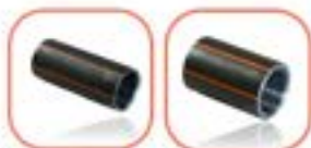
ข้อต่อแบบสวม A B