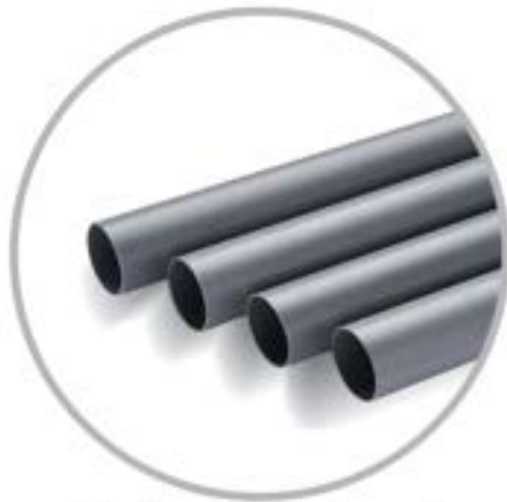
ชนิดปลายเรียบ ( Plain End )