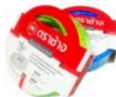
สายยางเพนซี่เสริมใย