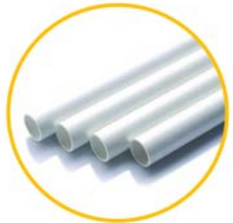
ชนิดปลายเรียบ ( Plain End )