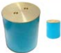
HCO กลิ่นเอิร์ท / BRASS Clean out