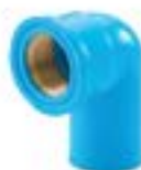
MLFB งอกสียวนอก n.a. BRASS FAUCET ELBOW 90