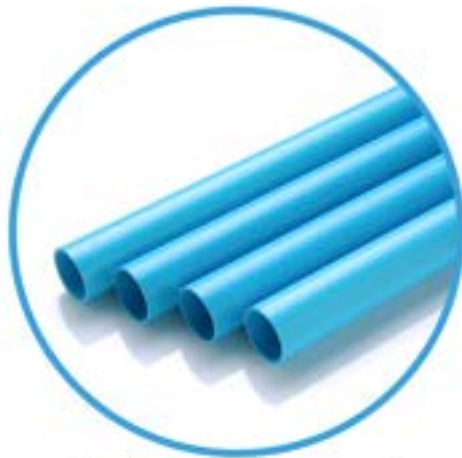
ชนิดปลายเรียบ ( Plain End )