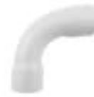
ZHWC90 ข้อโค้ง 90 SHORT BEND 90°