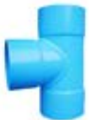
HT สามทาง / TEES