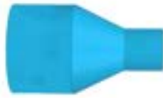
TSR ขั้วต่อทรงลดขนาด REDUCING SOCKET