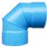
HL90 ขั้วอง 90 / ELBOW 90