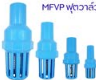
MFVP ฟุตวาล์ว PVC / Foot Valve