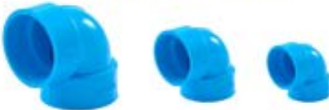
TLS 90 ขั้วองศา 90 / ELBOW 90