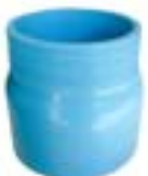
HSM ขั้วต่อตรงเกลียวนอก VALVE SOCKET