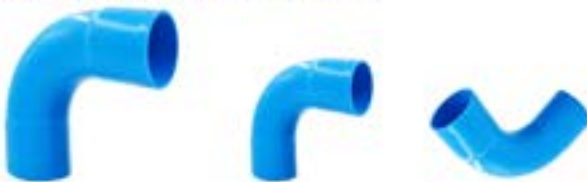
HC90 ข้อโค้ง 90 สีฟ้า / BENDS 90