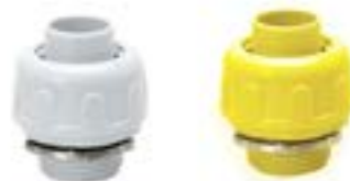
ข้อต่อท่ออ่อนลายลูกฟูก JIS