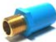
MSMB ต่อกสียวนอก n.a. BRASS VALVE SOCKET