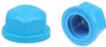
HCF ฝาครอบเกลียวใน FAUCET CAP