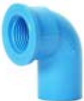
ข้องอเกลียวใน FAUCET ELBOW 90