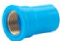
MSFB ต่อเกลียวใน ก.ส. BRASS FAUCET SOCKET