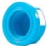
MCF ฝาครอบเกลียวใน FAUCET CAP