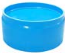
HC ฝาครอบ / CAPS