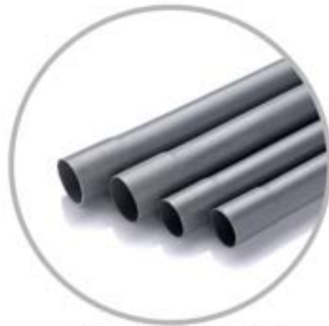
ชนิดบานหัว ( End Socket )