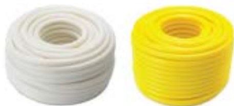
ท่ออ่อนลายลูกฟูก JIS