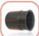
ข้อต่อปากแตร