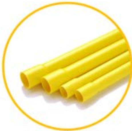
ชนิดบานหัว ( End Socket )