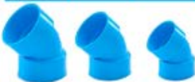
TLS45 ขั้วองศา 45 / ELBOW 45