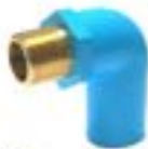
MLMB งอกสียวนอก n.a. BRASS VALVE ELBOW 90