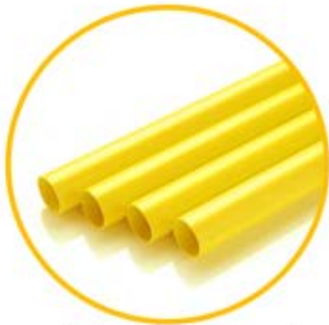
ชนิดปลายเรียบ ( Plain End )