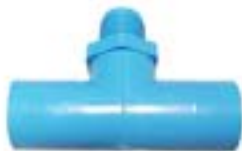
MTM สามทางเกลียวนอก VALVE TEE