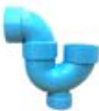
MPT พี - ไนส / P - TRAP