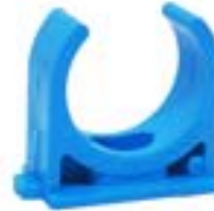
TCPM คลิปก้านปู (ฟ้า) / PIPE CLIP