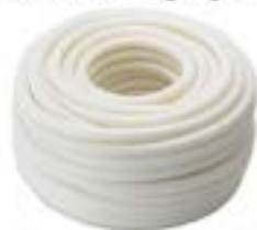
ท่ออ่อนลายลูกฟูก BS