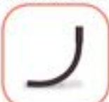
โค้งไฟฟ้า PE