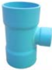
HTR สามทางลดข้อ / REDUCING TEES