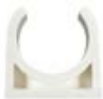
MWKC clipก้านปูสีขาว PIPE CLIP WEC