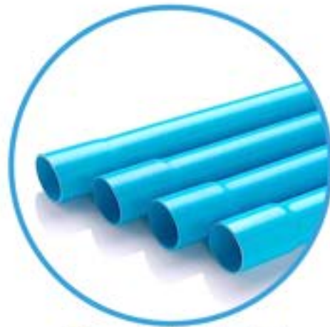
ชนิดนูนหัว ( End Socket )