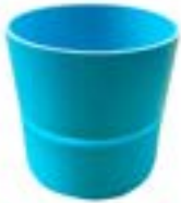
HS ขั้วต่อตรง / SOCKET