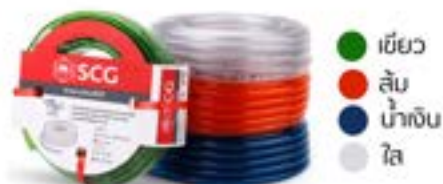
สายยางอ่อน PVC เพนซี่ 4 สี