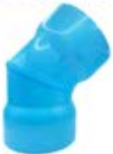
HL45 ขั้วอง 45 / ELBOW 45