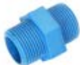
TN นิเปิ้ล PVC NIPPLE