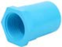
HSF ข้อต่อตรงเกลียวใน FAUCET SOCKET